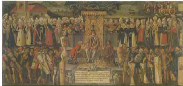
"Bizkaitarrek Fernando Katolikoa Erregeari 1476.ean egindako esku-mosua". Francisco Mendieta. 1609. Batzar Nagusiak jatorriz non egiten ziran ikusi leiteke eta lekukotza etnografiko bikaina da orduko jantziak zelangoak ziran ikusteko.

Batzarretxea eta Gernikako Haretza gure herriaren historiaren ikur biziak dira. Batzarretxea -Bizkaiko legebatzarraren egoitza da- eta Foru-Haretza Euskal Herrialdeen topagune dira, kultura- eta etnografia-tradizino berezi eta aberatsen jabe dan herri honen alkarleku.