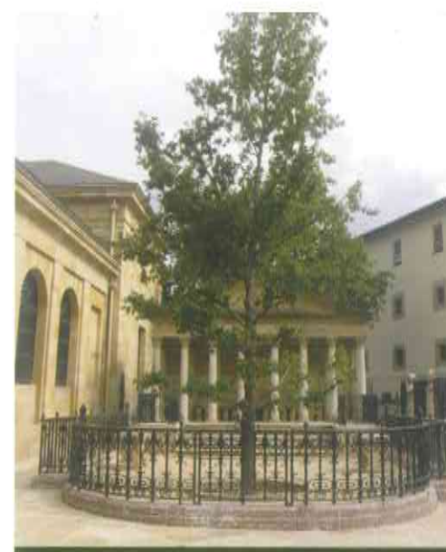
2005. urtean sartu eben Gernikako Haretza mendeetan Batzar Nagusiei gerizpea emon deuten Haretxaren oinordeko zuzena da.

Batzarretxearen aurrekaldeari begiratu ezker, laster baten ikusten da apainduraz gehiegikeriarik bakoa dala, eredu neoklasikoak agintzen eban moduan. Etxearen atzekaldean estalpeko jarlekuetarako erakintxua daukagu, zutabez hornidua