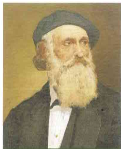
J.M. Iparragirre (1820-1881). Anselmo de Guineá, 1877.

Areto horretan dagoan gauzarik aitagarriena leiarrezko estalkia da, 1985.ean Bilboko Vidrieras de Arte S.A. enpresek egindako artisaularia. Gernikako Haretza Bizkaiko herrien topagune sinbolikotzat agertzen da leiarreko irudietan. Erdialdean Haretza eta jarlekuak dagoz, antxinako jatorrizko Batzar Nagusien gomutagarri; albo baten "Lege Zarra" idatzita agertzen da, Bizkaiko Jaunek zin eta bete egin behar ebezan Legeak gogorazoteko; eta, beste alde batetik, Lurraldearen ekonomiari buruzko irudiak. Inguru guztian Bizkaiko herrietako monumenturik adierazgarrienak agertzen dira.