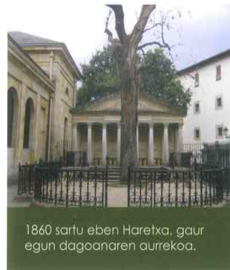
1860 sartu eben Haretza, gaur egun dagoanaren aurrekoa.

Inguru hori gauza berezietarako erabilten da gaur egun, Lehendakariak eta Ahaldu Nagusiak karguari zin egin behar deusienean, esaterako. Oritari baten jasota dagoz Jose Antonio Agirre Lehenengo Lehendakariak zina egiteko esandako berbak. Berbok eredu bihurtu dira leku horretan zin egin behar daben agintarientzat.