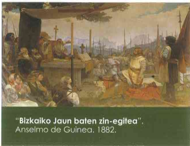
"Bizkaiko Jaun baten zin-egitea". Anselmo de Guinea. 1882.